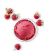
Douceur de framboise