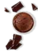
Chocolat et ses morceaux