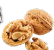
Noix avec morceaux de noix