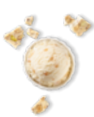
Nougat de Montélimar