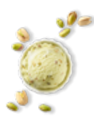
Pistache et ses morceaux