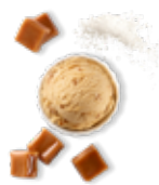
Caramel au beurre salé