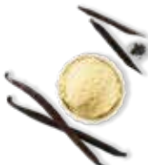
Vanille intense de Madagascar