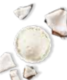
Noix de coco