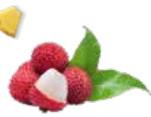
Litchi de la Réunion