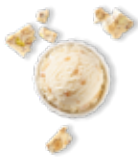
Nougat de Montélimar