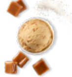
Caramel au beurre salé