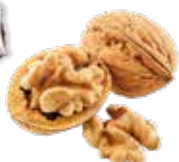
Noix avec morceaux de noix