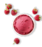
Douceur de framboise