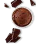
Chocolat et ses morceaux