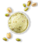
Pistache et ses morceaux